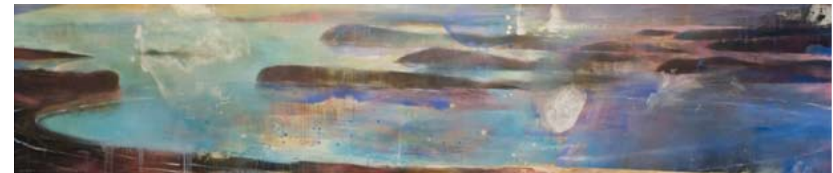
Simon Kajtna, Morska krajina z nevihto, 2017, olje / platno, 50 x 240 cm