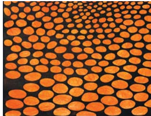
Jožica Medle, Žareči jantar, 2017, mešana tehnika / papir, 100 x 70 cm