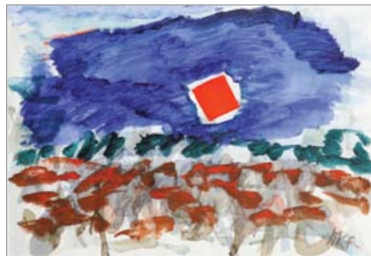
Martina Koritnik Fajt, Sonce 1, 2017, akril, akvarel / papir, 61 x 43 cm