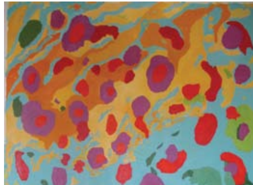
Martina Hegediš, Pesem o jantaru iz Baltiškega morja, 2017, olje / platno, 100 x 143 cm