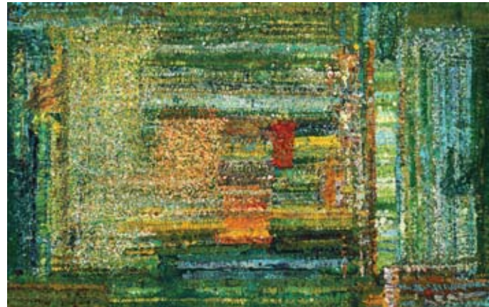
Jože Marinč, Zaljubljene rože, 2017, akril / platno, 120 x 200 cm