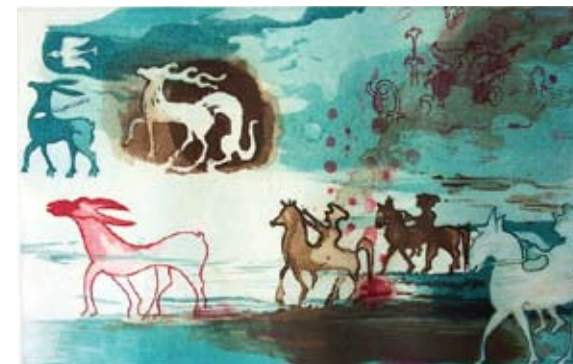
Svetlana Jakimovska Rodič, Halštatska kamasutra (iz grafične mape Dnevnik Halštata), 2010, barvna jedkanica, akvatinta / papir, 50 x 70 cm