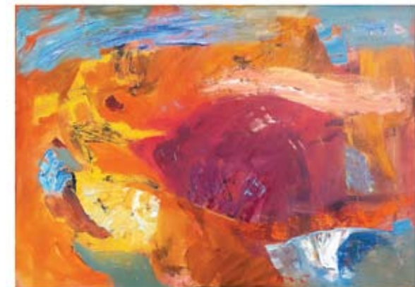
Janko Orač, Jantarna krajina, 2017, olje / platno, 50 x 70 cm