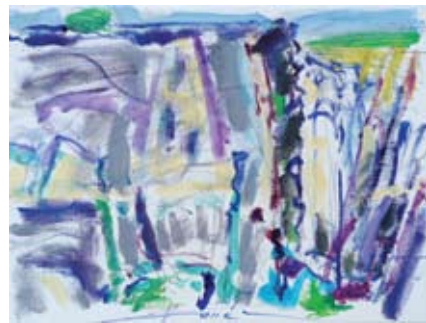
Alojz Konec, Skica okamenele zgodbe, 2017, olje / platno, 18 x 24 cm