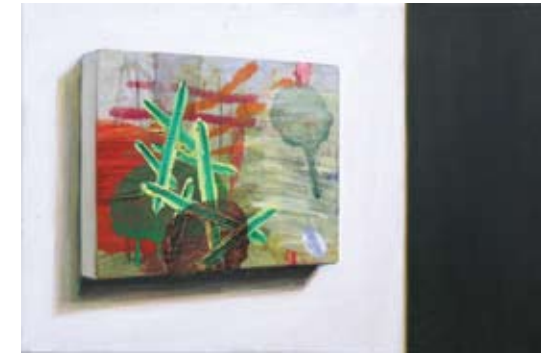
Robert Lozar, Jantarja trenutno nimamo, 2017, mešana tehnika / platno, 40 x 60 cm