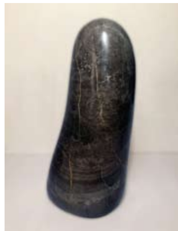
Boštjan Kavčič, Element, 2017, apnec Rodine, 36 x 18 x 14 cm