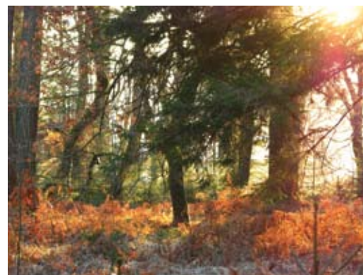
Mateja Kavčič, Gozd, 2015, fotografija - print, 30 x 40 cm